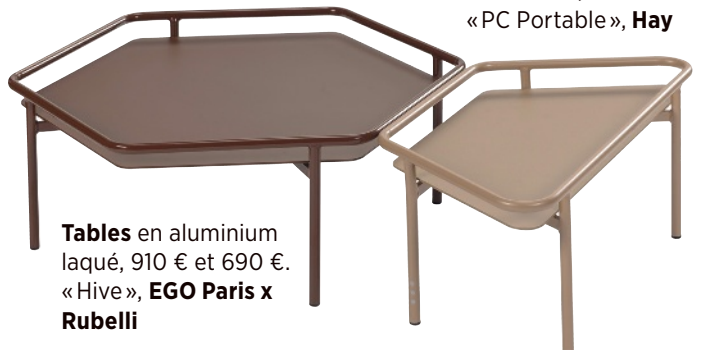
Tables en aluminium laqué, 910 € et 690 €. «Hive», EGO Paris x Rubelli