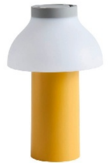
Lampe d'extérieur rechargeable, H. 22 cm, 109 €. «PC Portable», Hay